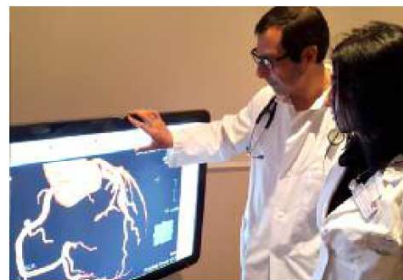
Lo studio dei vasi arteriosi attraverso il nuovo sistema