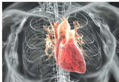
Il cuore in 3d visto attraverso il software Synapse

VARESE La Fondazione Iseni y Nervi, nata nel 2004, ha sviluppato presso gli Istituti di Ricovero e Cura Gruppo Iseni Sanità di Lonate Pozzolo-Malpensa (Varese) un nuovo sistema per la diagnosi delle malattie cardiache e dell'apparato cardiocircolatorio. Grazie ad un nuovo software, che è già operativo, gli specialisti ricostruiscono su maxi schermi le immagini tridimensionali del cuore del paziente e riescono ad individuare patologie e anomalie che altrimenti resterebbero nascoste, in un numero del 30% in più rispetto ai sistemi tradizionali. Le malattie cardiovascolari, secondo i dati dell'Istituto superiore della sanità, sono la prima causa di morte in Europa e nel mondo; per prevenire questo tipo di patologie è ora disponibile un nuovo software che consente di elaborare tridimensionalmente le immagini di tac, risonanze magnetiche, ecografie ed ecografie "ricostruendo" il cuore in 3d. Agisce come una "lente di ingrandimento" che consente, per esempio, di individuare le placche dei vasi arteriosi che normal-