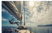
Estate in barca alla riscoperta del mare italiano