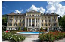
Riaprire il Grand Hotel Imperial di Lecco Terme