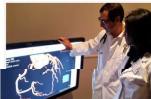
I cardiologi studiano le coronarie del paziente

"Giornata della prevenzione cardiovascolare": venerdì 20 maggio alle porte di Malpensa un convegno di specialisti provenienti da tutta Italia per sperimentare la tecnologia per gli esami del cuore in 3D