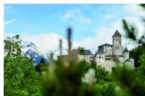
Vacanze green in montagna