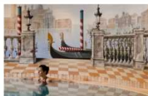
Riapertura in nuove vesti del Das Central di Sölden