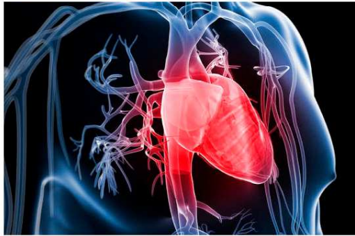
3d rendered illustration of the human vascular system

In tempi di crisi ci sono spese a cui non si può rinunciare. E sono quelle per la propria salute.